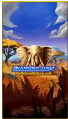
Diamond Link™ Mighty Elephant