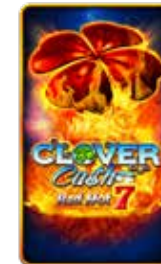
Clover Cash Red Hot 7