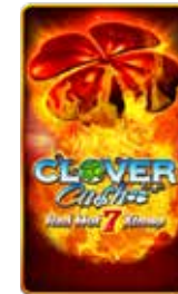
Clover Cash Red Hot 7 Xtreme