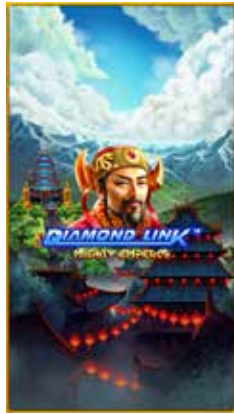
Diamond Link™ Mighty Emperor