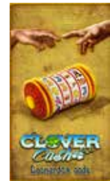
Clover Cash Leonardo's Code