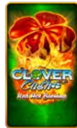
Clover Cash Red Hot Burning