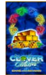
Clover Cash Bars and Sevens