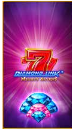
Diamond Link™ Mighty Seven