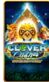
Clover Cash Emperors of the Nile