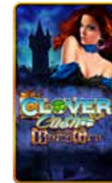
Clover Cash Blazing Gems