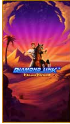
Diamond Link™ Oasis Riches