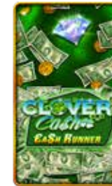
Clover Cash Cash Runner