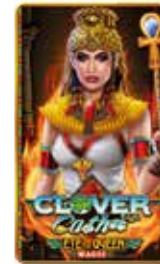
Clover Cash Eye of the Queen

Zusätzliche Preise und Features versprechen mehr Spannung und Unterhaltung, denn jedes Zusatzfeature verspricht neue Gewinne und dabei können weiter fleißig CLOVER gesammelt werden um einen der 4 Bonus-Level MINI, MINOR, MAJOR und GRAND zu gewinnen!