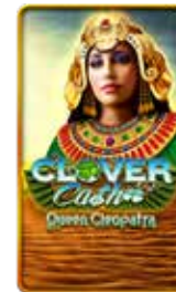
Clover Cash Queen Cleopatra