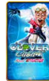
Clover Cash Reel Attraction